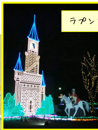
ラプンツェルの塔