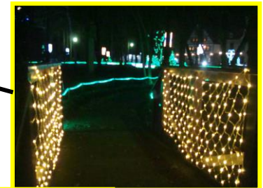
園路や木々もライトアップ