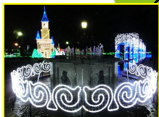
噴水からの流れはアーチをくぐり、白鳥の城が建つ池へと注ぎます。