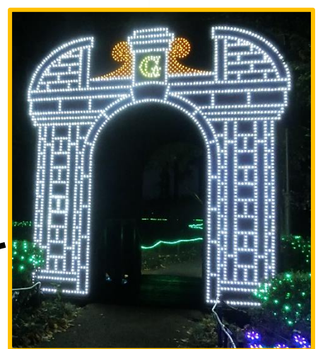
お城に向かう橋に城門が架かりました！