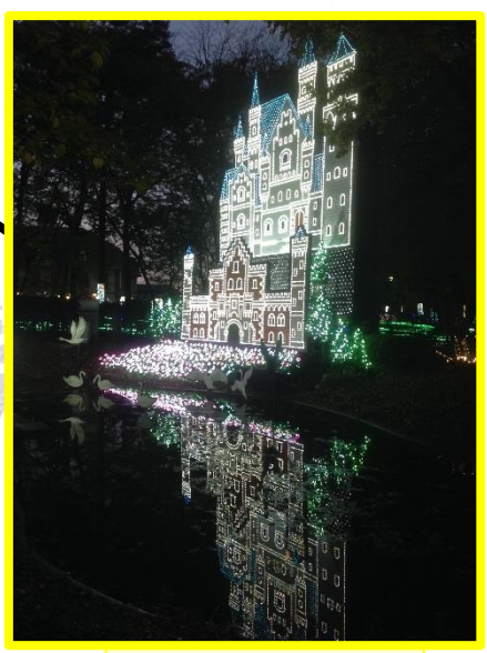
池に映る白鳥の城