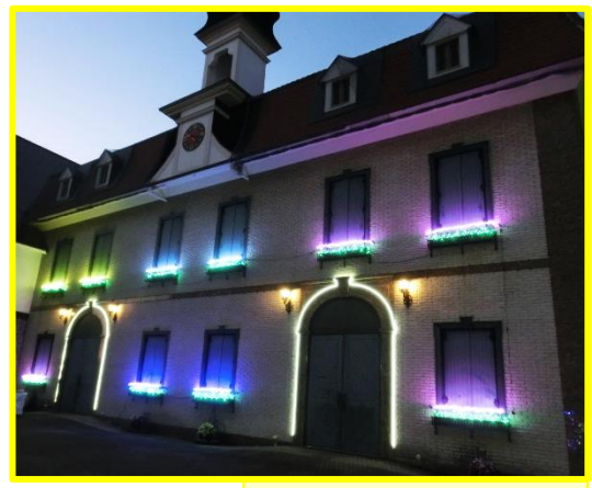
フラワープランター