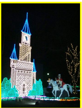
ラプンツェルの塔