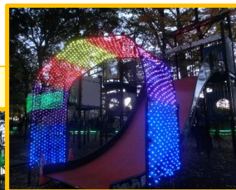
虹色の滑り台で花畑に飛び込もう！