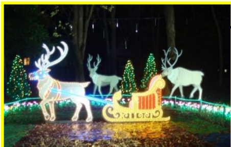
ソリに乗って記念撮影ができます！

第13回グリムの森イルミネーション 開催期間：2023.11.26～2024.1.3 17:00～21:00