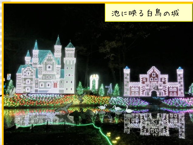
池に映る白鳥の城