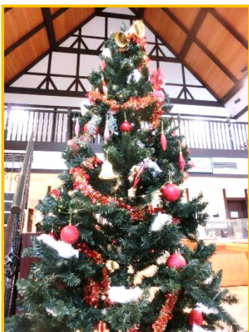
グリムの館内のツリー