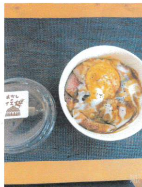
○ローストビーフ丼

※要予約、またはお作りするのに 30分かかります (日替り人気No.1、食べたくても 中々食べれない幻のメニュー?)